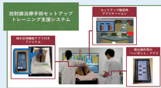
医学研究院 放射線治療のための患者 セットアップトレーニング支援教材の開発