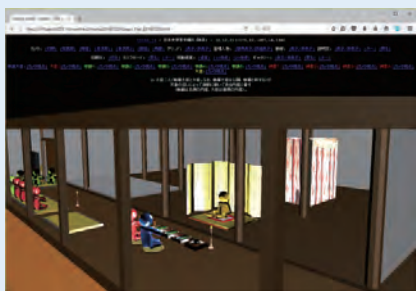
文学部 日本史学を対象とした教材開発

申込方法 教材開発センターの Web サイトよりお申し込みください http://www.icer.kyushu-u.ac.jp/topics_20181029_2